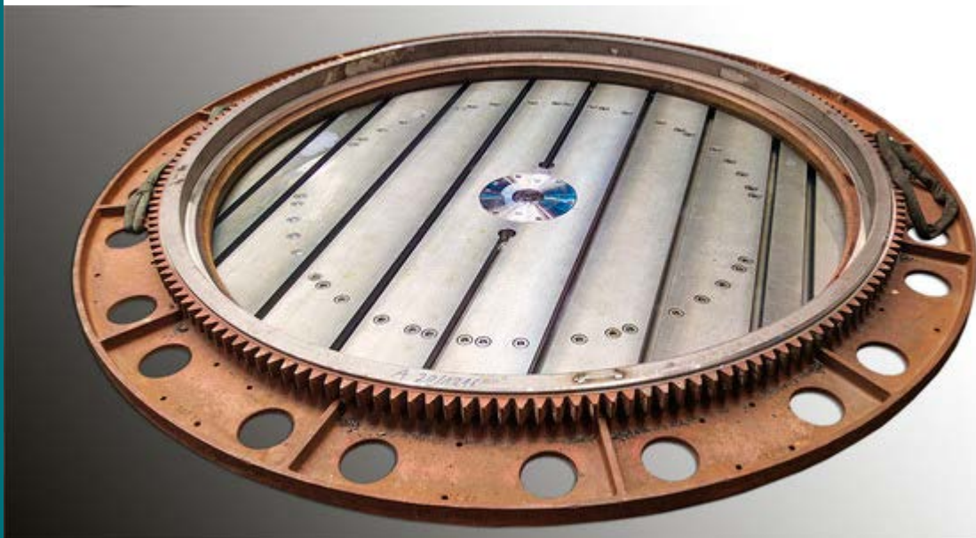
Zahnkranz des SRB 1900 mit neuer Lagerung

Ihr Vorteil: Der eingesetzte Ring wird individuell vermessen und ermöglicht Ihnen für spätere Reparaturen einen passgenauen Ersatz.